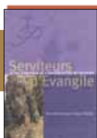
Actes du synode Serviteurs d'Évangile