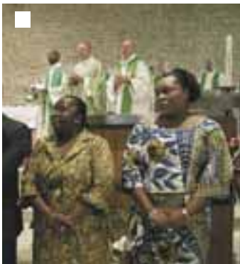
Installation de la communauté locale africaine à Poitiers.

“Chaque communauté locale [...] pourra garder une part de vie propre et être soutenue par une équipe locale d’animation”.