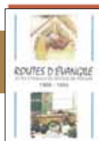
Actes du synode Routes d'Évangile