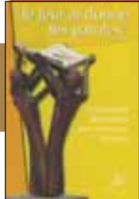
Orientations diocésaines pour l'annonce de la foi