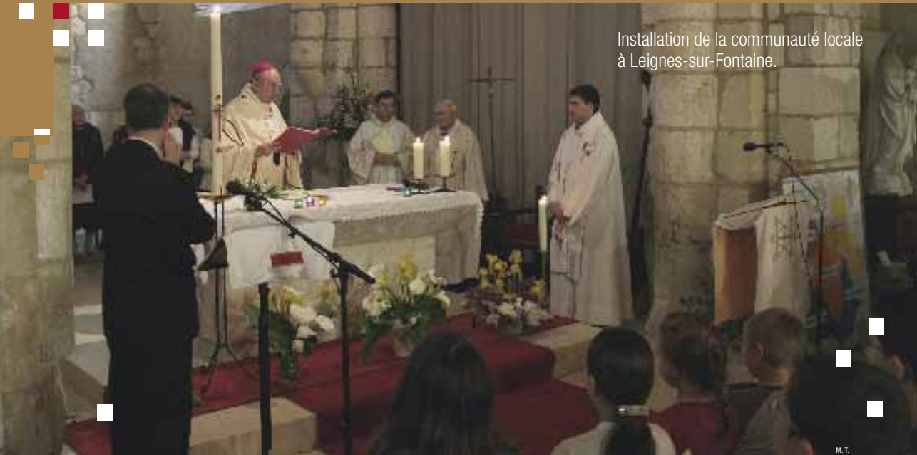
Installation de la communauté locale à Leignes-sur-Fontaine.