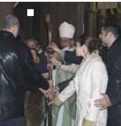
Renouvellement de communauté locale.

(Concile Vatican II : Décret sur la charge pastorale des évêques , 11)